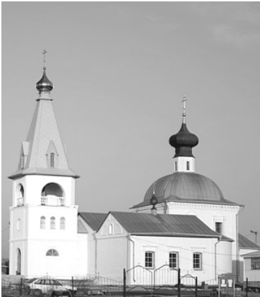
ХРАМ СВЯТИТЕЛЯ НИКОЛАЯ ЧУДОТВОРЦА.